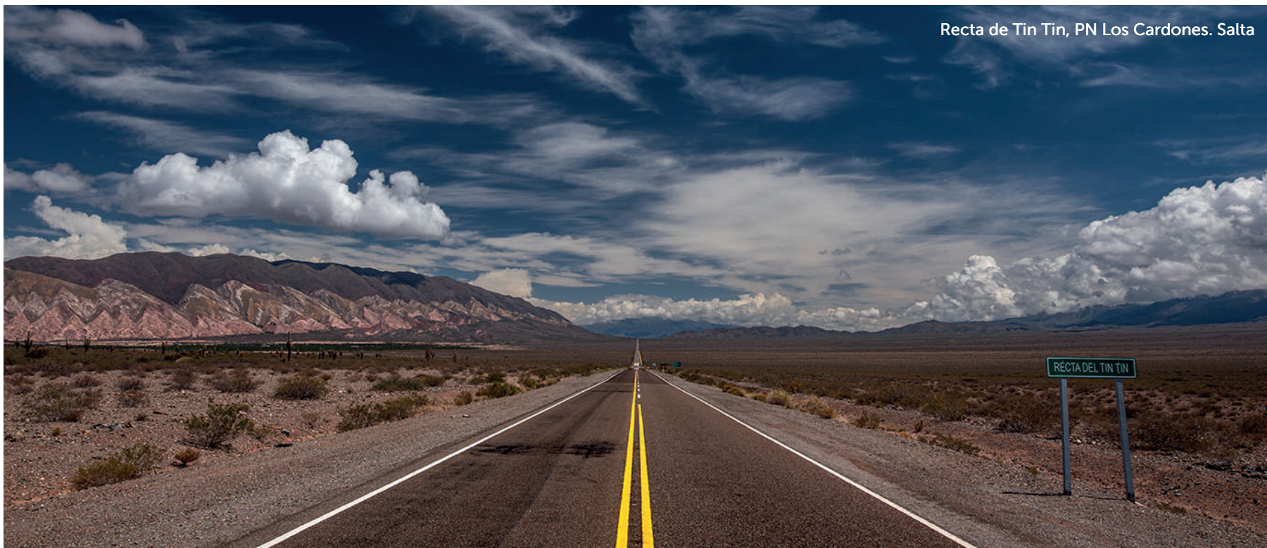
Recta de Tin Tin, PN Los Cardones. Salta