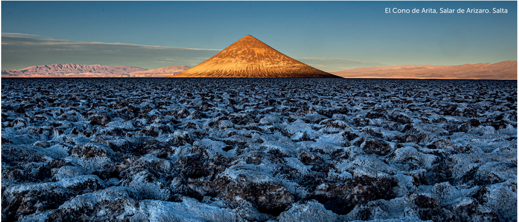
El Cono de Arita, Salar de Arizaro. Salta