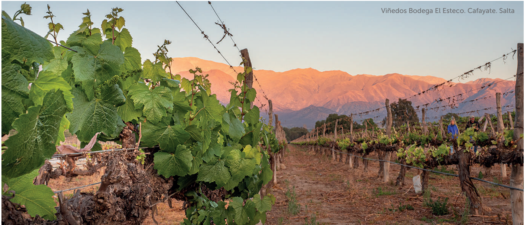
Viñedos Bodega El Esteco. Cafayate. Salta