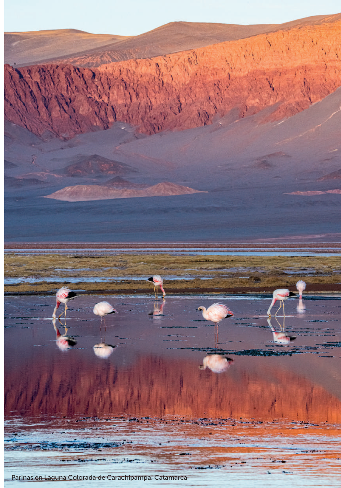
Parinas en Laguna Colorada de Carachipampa. Catamarca