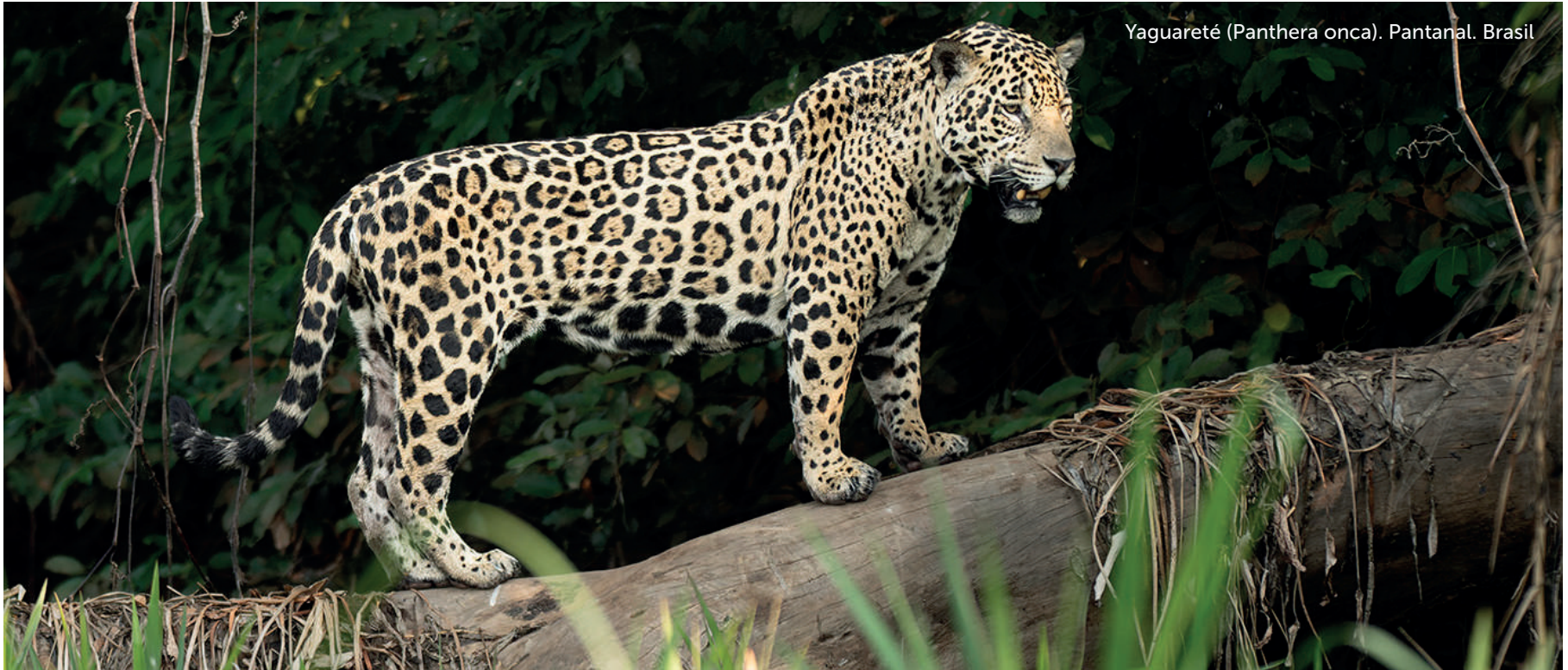
Yaguareté (Panthera onca). Pantanal. Brasil