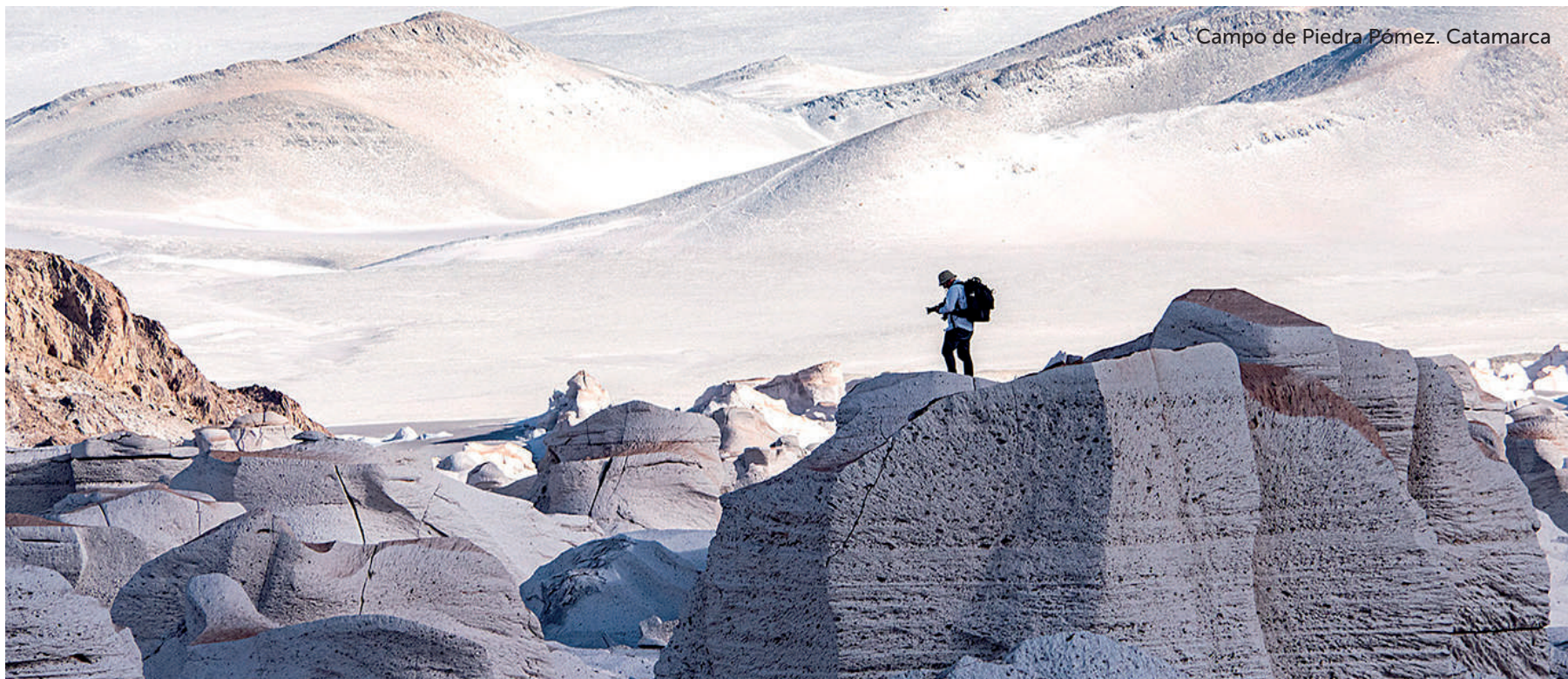
Campo de Piedra Pómez. Catamarca