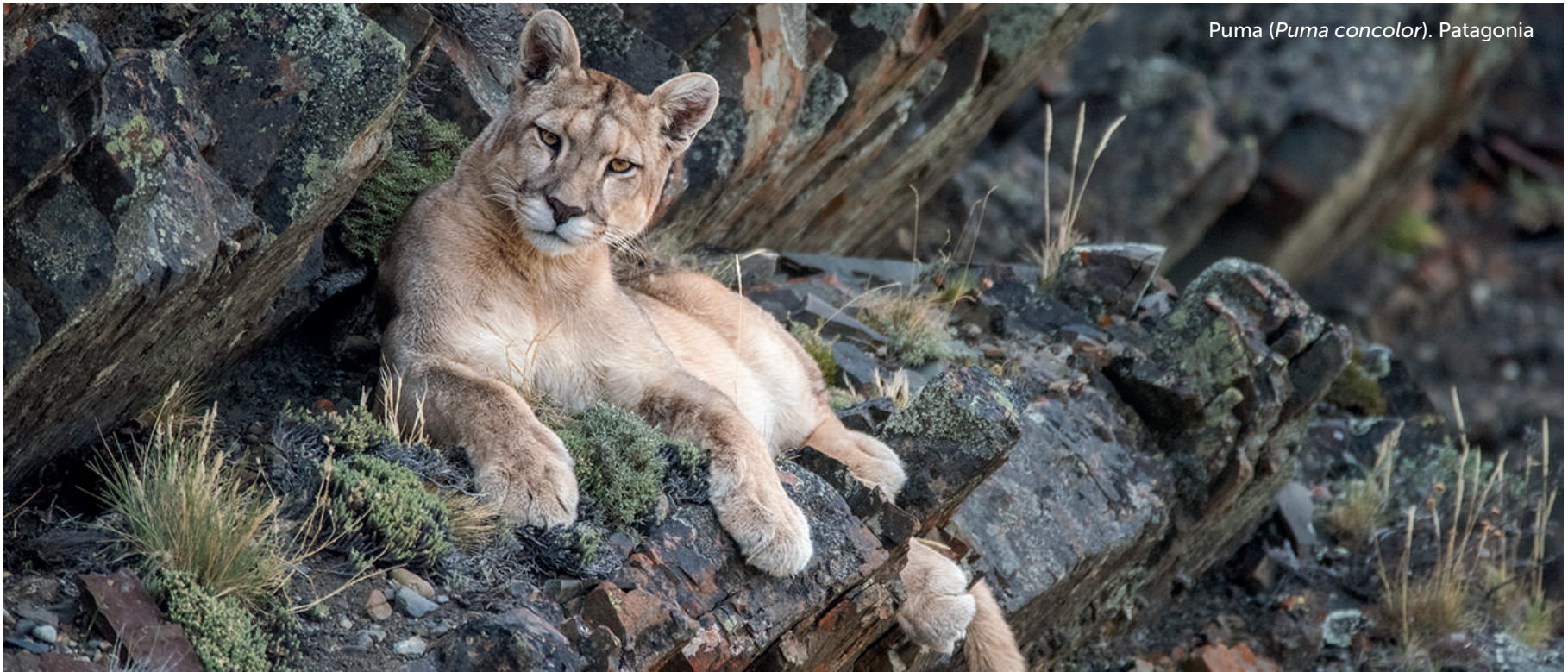
Puma ( Puma concolor ). Patagonia