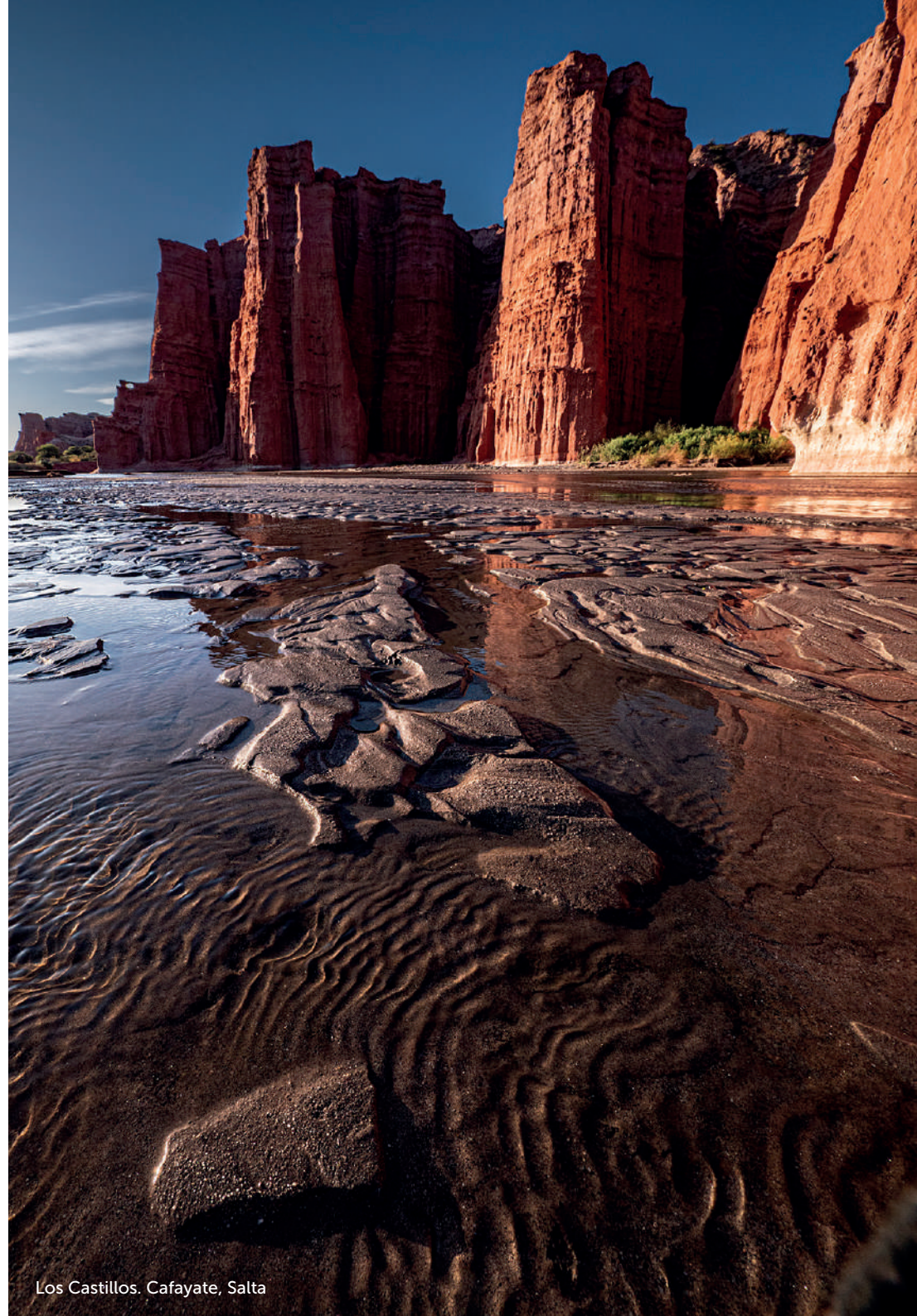
Los Castillos. Cafayate, Salta