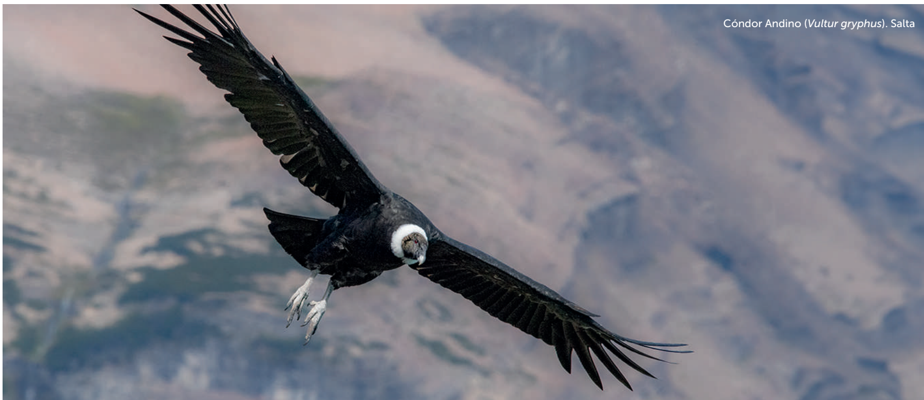
Cóndor Andino ( Vultur gryphus ). Salta