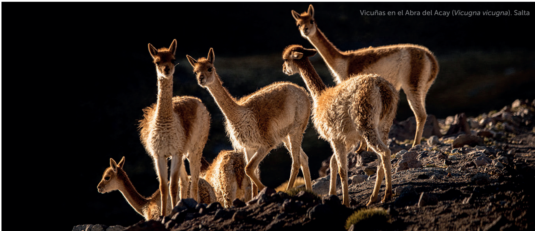
Vicuñas en el Abra del Acay ( Vicugna vicugna ). Salta