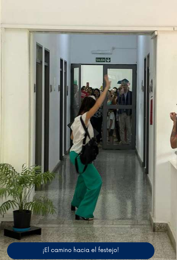
¡El camino hacia el festejo!