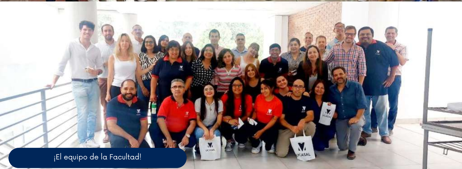
¡El equipo de la Facultad!