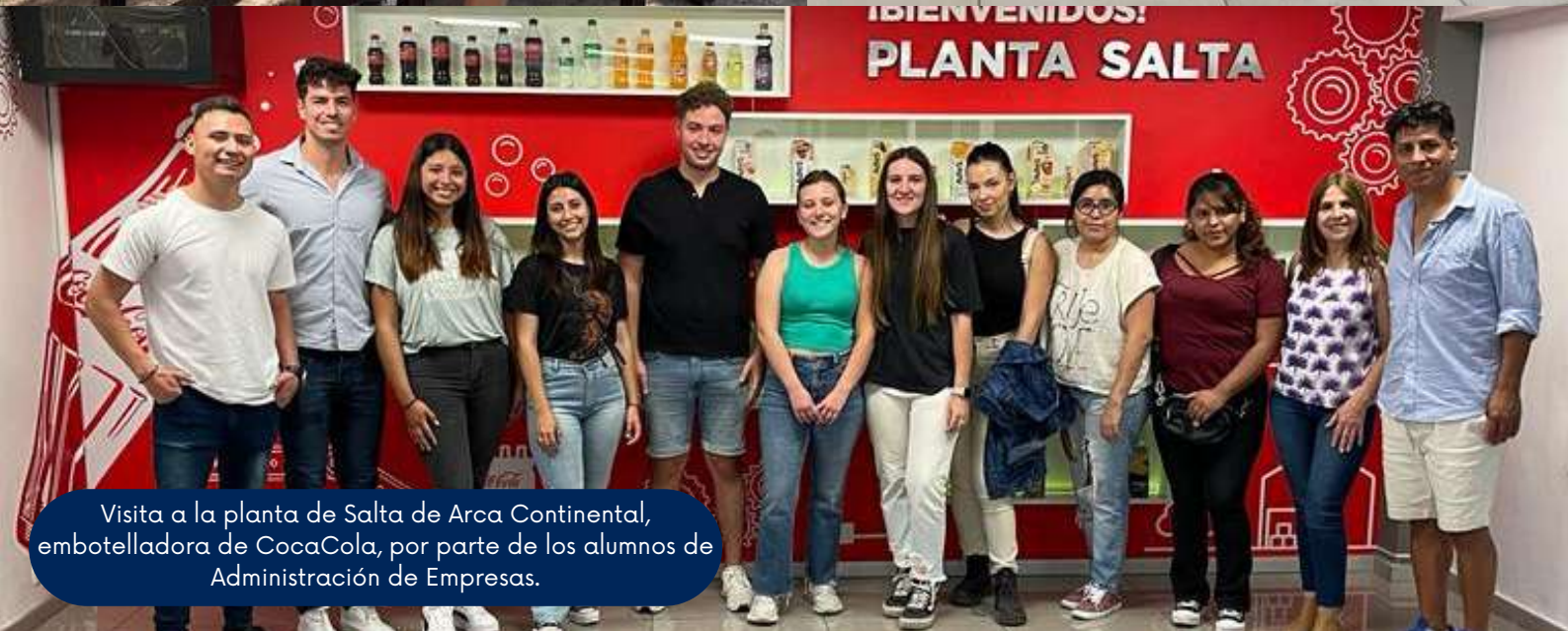
Visita a la planta de Salta de Arca Continental, embotelladora de CocaCola, por parte de los alumnos de Administración de Empresas.