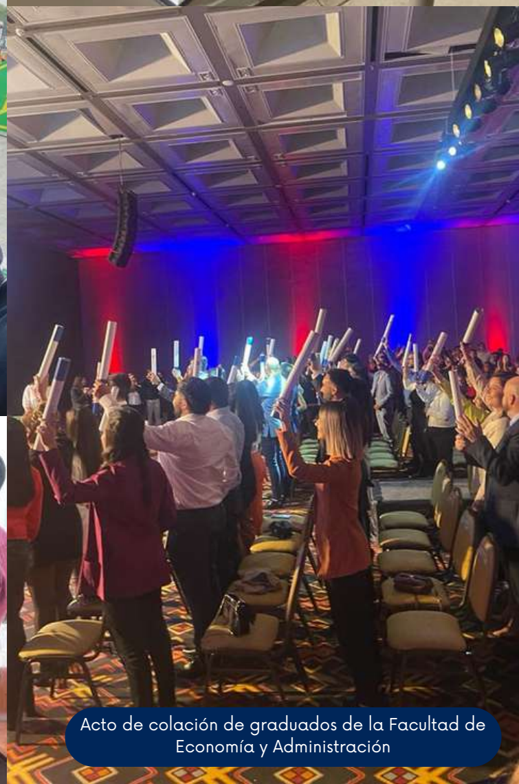
Acto de colación de graduados de la Facultad de Economía y Administración